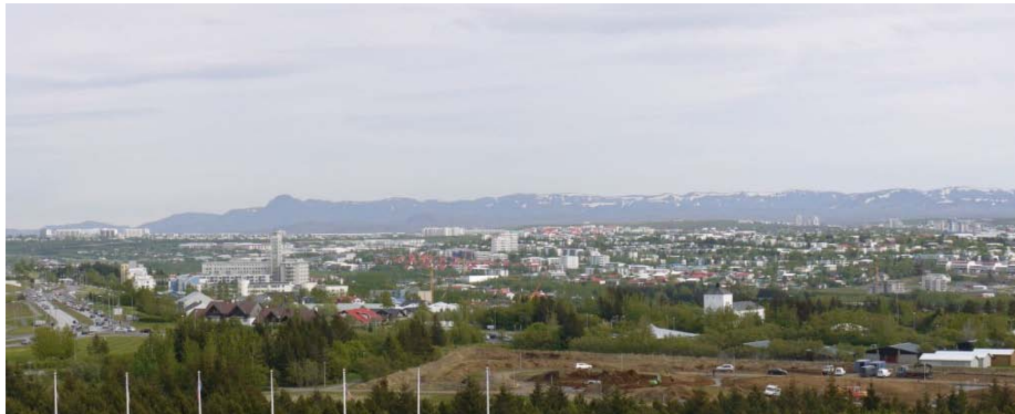
Schon am Klimaziel: Reykjavik versorgt sich zu 100% über geothermische Fernwärme – die Stadt München verfolgt bis 2040 als erste europäische Großstadt den gleichen Weg.

Nach dem aktuellen Diskussionsstand um das Frackinggesetz soll Fracking künftig auch unterhalb von 3000 Metern verboten sein bzw. nur zu Erkundungszwecken oder unter besonderen Voraussetzungen erlaubt werden. Das käme einem Todesstoß für die Tiefe Geothermie in Deutschland gleich.